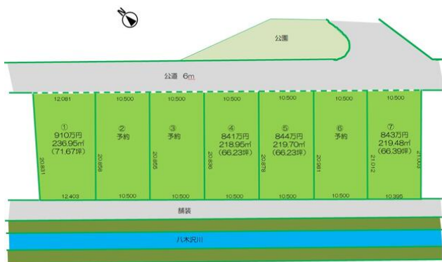
※情報と現況が異なる場合は現況を優先します。